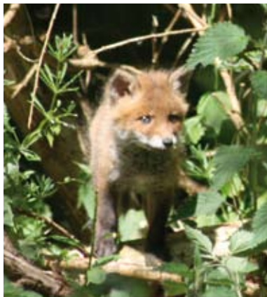
Vossenjong in het Windbos

Dit jaar is de samenstelling van de contactgroep Hoekwierde en de naam gewijzigd in Bewonersgroep Hoekwierde. Er is veel gebeurd en veel werk gedaan. Het groot onderhoud schiet op en in deze tweede nieuwsbrief leest u wat er gedaan is in de buurt en wat er op stapel staat. Als u denkt een bijdrage te kunnen leveren dan horen wij graag van u. Misschien heeft u zelf wel iets om te melden om met uw burens te delen? Dat mag ook via deze nieuwsbrief! Samen met u maken we een leefbare, mooie en communicatieve wijk.