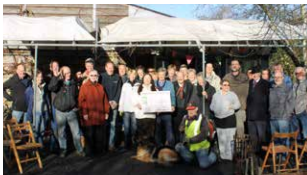
Groen Dichterbij Icoonprijs 2014