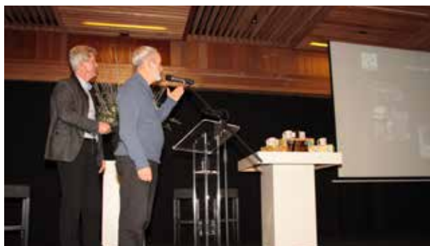
Verkiezing Beste Beheerteam van Nederland

De deelnemers van het EZH verkreeg in Zoetermeer tijdens een congres voor beheerders van Nederland de tweede prijs in de wedstrijd, het beste beheerteam van 2013.