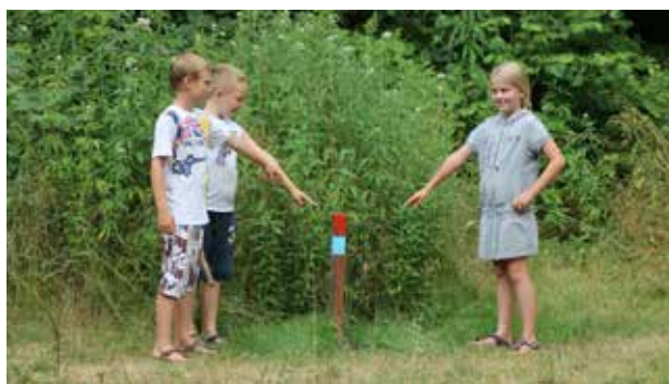
Oranjefonds paaltjes wandelroute

In het voorjaar schonk het Oranjefonds 450 euro voor de routering van de wandelpaden.