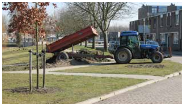
Omvorming gebied rond de steiger

Thom en Elly zijn enthousiaste zelfbeheerders. Zij zijn begonnen met een paar meter haag van de volkstuin. En elke maand werd het gebied vergroot. En zo ontstond het idee om het gehele gebied rond het huis te gaan herinrichten. De steiger is van de zomer rolstoeltoegankelijk gemaakt. Het gebied rond de paden is gefreesd. Het is het plan in dit gefreesde gedeelte struiken te planten. Ook drie stukjes gras in de nabijheid van hun woning zullen ingeplant gaan worden met struiken.