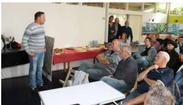
Gemeente Hollands Kroon

In week 40 kwam er nog een grote groep uit de Kop van Noord Holland naar onze wijk. Het programma kent inmiddels dezelfde beproefde opzet. Een inleiding, gevolgd door een rondwandeling. Het verhaal van de herinrichting van het grote veld, het kunstwerk van AM en de ontwikkelingen in het Vogel- en Windbos.