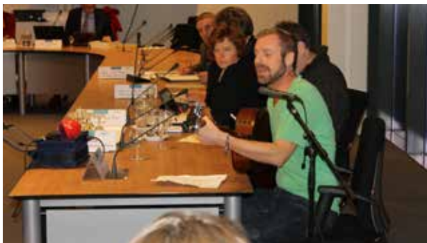
Een flat? Dat nooit!