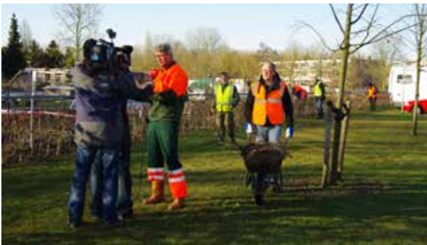
Hart van Nederland

Het zelfbeheer was ook een kort item in Hart van Nederland.