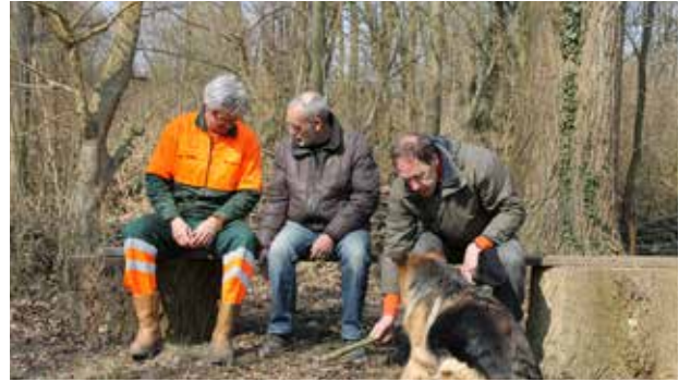
Natuurlijke banken in het Windbos

Banken met een onderstel van hout uit het Windbos. Ouwe regelt waar wij een paar hardhouten planken kunnen ophalen. En wij hebben twee prachtige rustplekken aan de rand van de twee open plekken in het Windbos.