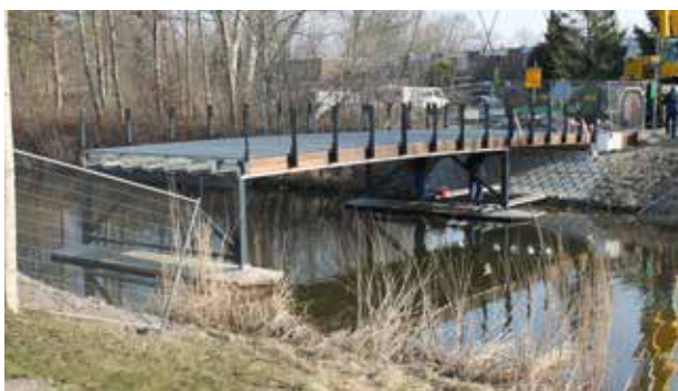
Nieuwe fietsbrug (Kornbrug)

Net voor de komst van de eerste zwaluwen is de oude versleten fietsbrug (Kornbrug) vervangen door een nieuw exemplaar.